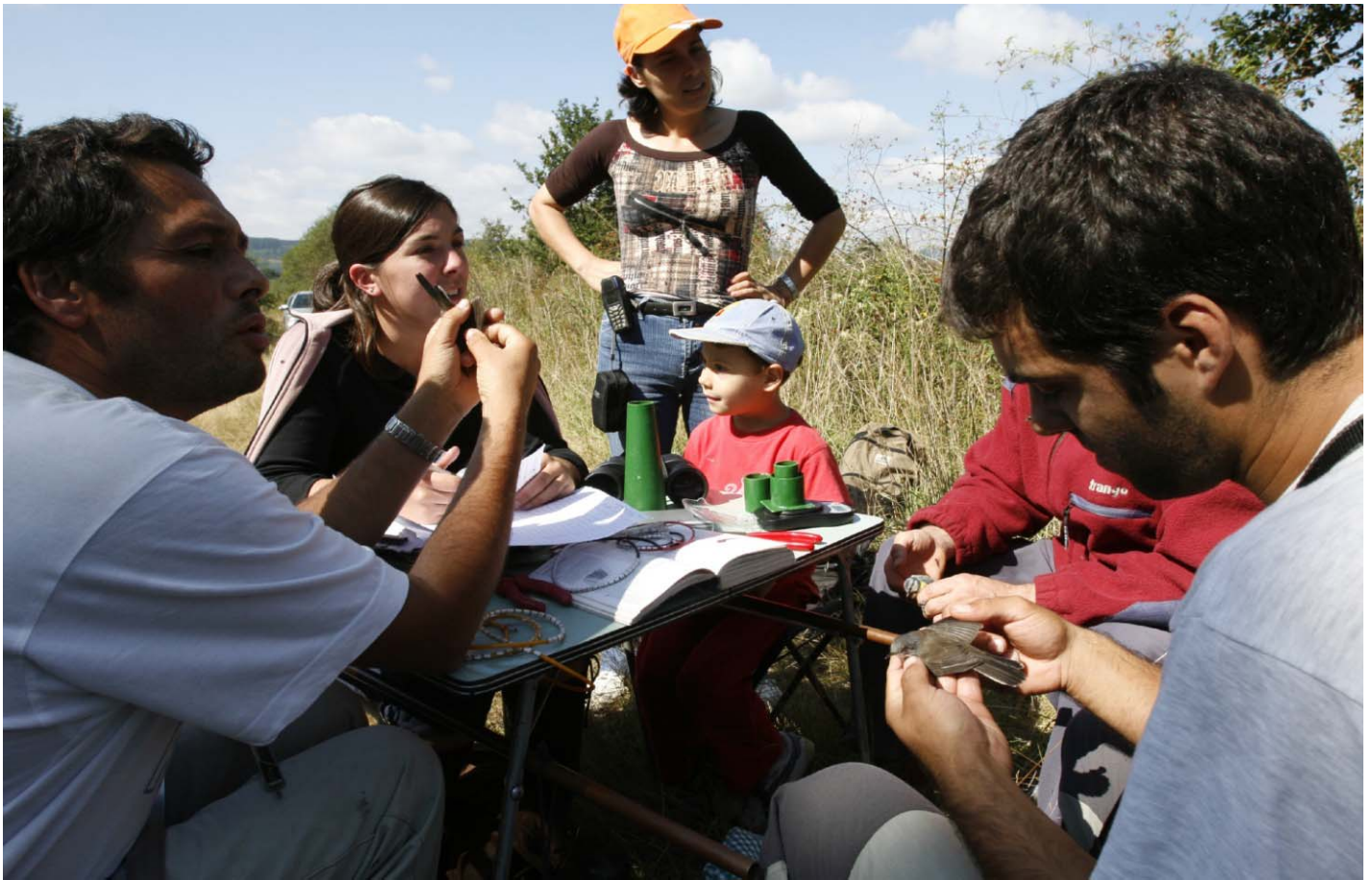
Foto 9. 22/09/2007. Datado e sexado de papuxas, por membros do grupo Anduriña. Especie: Sylvia melanocephala (dereita).