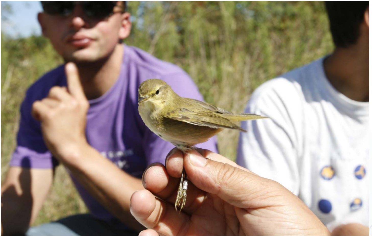
Foto 4. 22/09/2007. Resultaron datas de captura interesantes (por serodias) para algunas especies estivais. Especie: Phylloscopus ibericus .

Ata hai non tanto tempo, os habitantes do val de Lemos capturaban inxentes cantidades de papuxas ( Sylvia spp.) [foto 5] [foto 9] para consumo, especialmente en forma de “empanada de papuxas”. Afortunadamente, esta tradición está desaparecendo case ao mesmo ritmo que se degradan os hábitats aínda favorábeis paras estes fermosos passeriformes: sebes de matogueira, sebes arboladas, monte baixo entre cultivos e soutobosque rico en bagas.