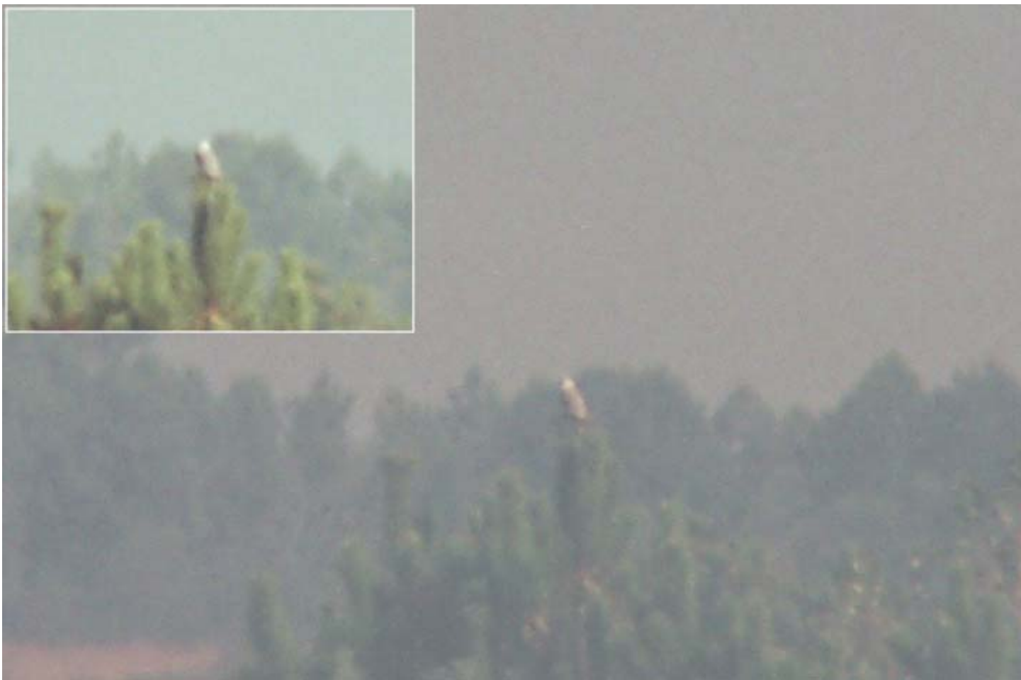
Foto 3. 22/09/07. O mellor que se puido facer, empregando digiscoping . Especie: Elanus caeruleus .

Pasou de novo o peneireiro cincento desta volta máis preto do campamento base á vez que diminuía o ritmo de capturas e que parte do grupo (Pillara) buscaba un novo lugar para anelar no límite dos concellos de Bóveda e Pobra do Brollón, un par de quilómetros ao sueste. Relocalizado o peneireiro pousado enriba dun piñeiro algo apartado da zona, houbo un que non se resistiu a fotografalo, con resultado discreto... [foto 3]