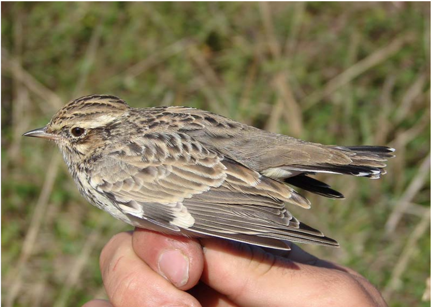
Foto 6. 22/09/2007. Unha captura pouco habitual. Especie: Lullula arborea . Autor: © Pablo Sanmartín / Anduriña.