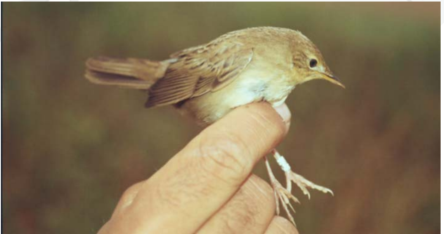
Foto 12. 23/09/2007. Algúns migradores cairon na rede; este o fixo moi de mañá. Especie: Locustella naevia.