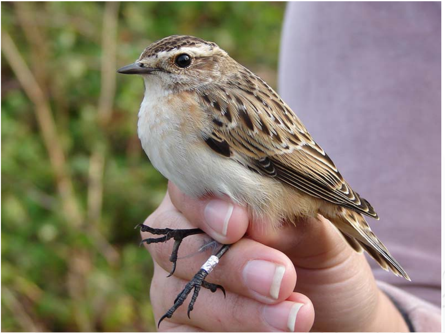
Foto 8. 22/09/2007. A perseverancia dá os seus froitos. Especie: Saxicola rubetra .

De onde estabamos anelando, foron eliminados meses atrás centos de metros cadrados de sebes por mor da concentración parcelaria, obedecendo unha (resesa) política agraria que prima a cantidade en detrimento da calidade... todo o contrario do que se recomenda e se subvenciona hoxe en día desde Bruxelas: nos países “ricos” da Europa dos 25, primase agora o conservar eses reductos de agricultura tradicional, potenciar os policultivos e apostar pola calidade dos produtos. Mágoa esta oportunidade desaproveitada, e mágoa de hábitat para as papuxas e outros animais.