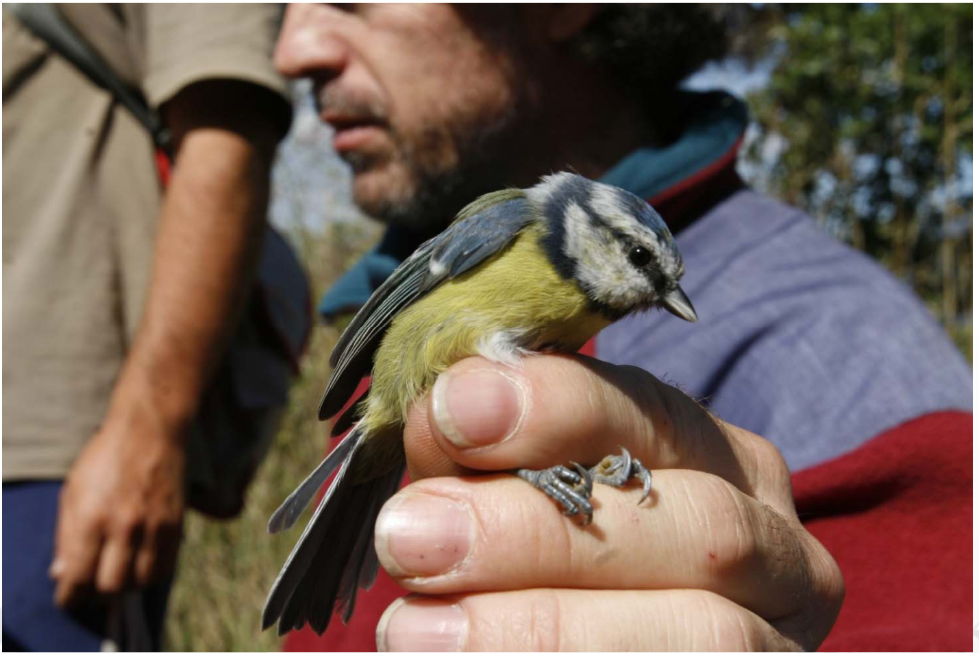
Foto 16. 22/09/2007. Este ferreiriño azul peteirou máis dunha vez ao anelador (Manuel Alonso / Anduriña). Especie: Parus caeruleus .