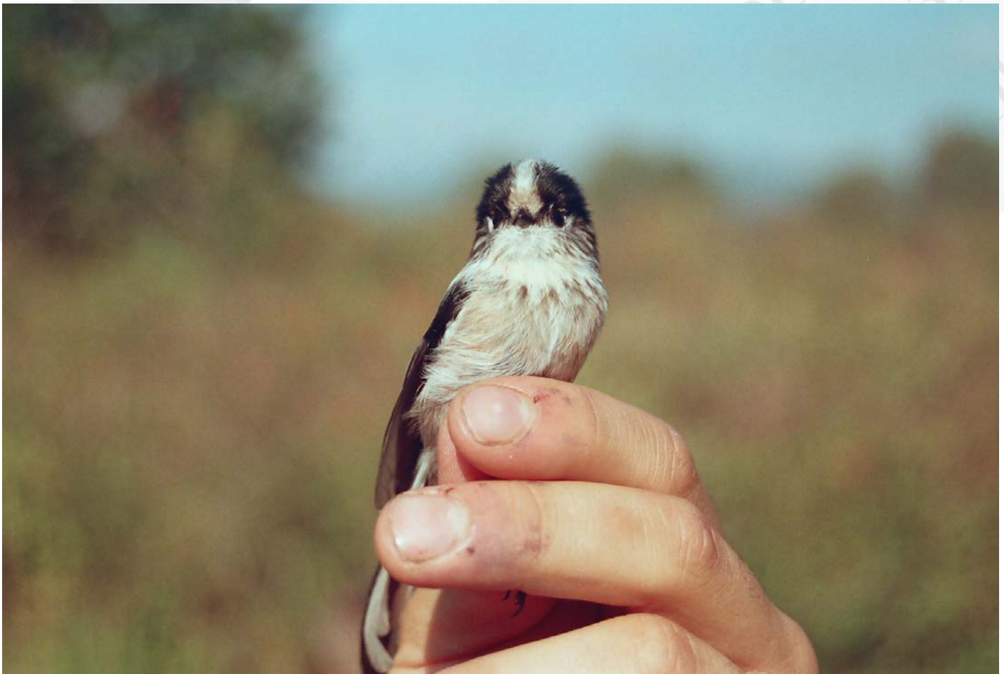
Foto 17. 22/09/2007. O contorno arbóreo con carballos e piñeiros propicia a aparición de especies como o ferreiriño rabilongo, que tamén foi capturado nas xornadas de anelamento. Especie: Aegithalos caudatus .