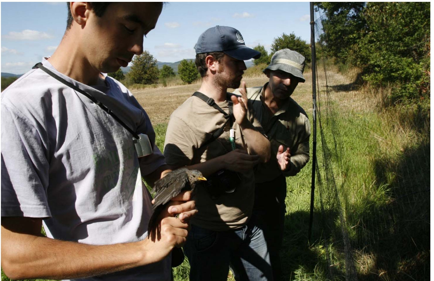
Foto 7. 22/09/2007. Recén collido da rede. Especie: Turdus merula .