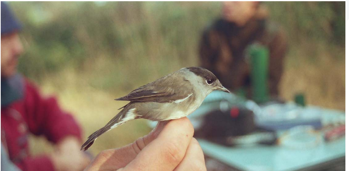
Foto 5. 22/09/2007. Afortunadamente, as “empanadas de papuxas” semellan cousa do pasado. Especie: Sylvia atricapilla .

Ata hai non tanto tempo, os habitantes do val de Lemos capturaban inxentes cantidades de papuxas ( Sylvia spp.) [foto 5] [foto 9] para consumo, especialmente en forma de “empanada de papuxas”. Afortunadamente, esta tradición está desaparecendo case ao mesmo ritmo que se degradan os hábitats aínda favorábeis paras estes fermosos passeriformes: sebes de matogueira, sebes arboladas, monte baixo entre cultivos e soutobosque rico en bagas.