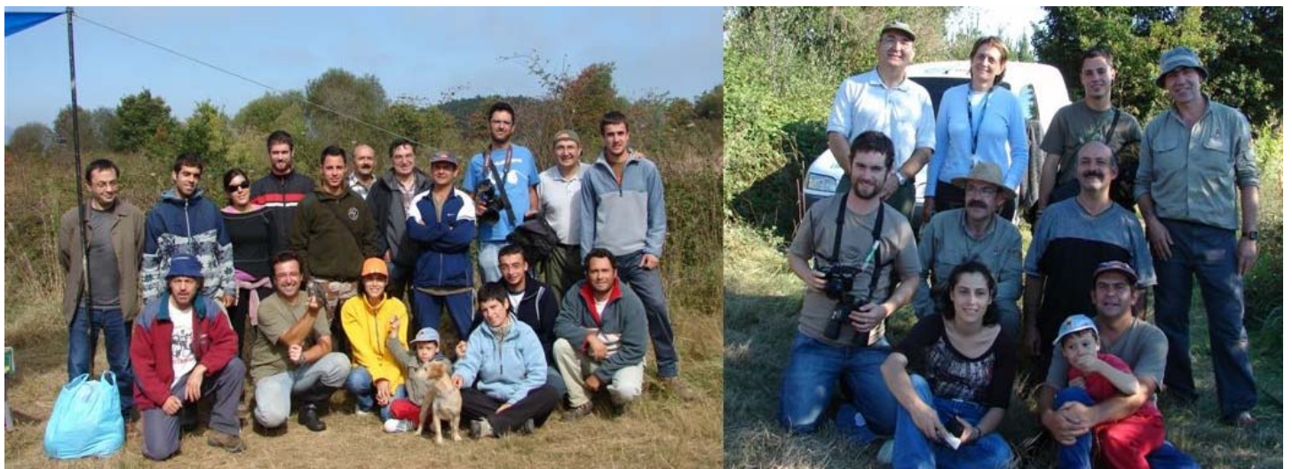
Foto 1. 23/09/07. Á esquerda, a maioría dos participantes na xuntanza, agás os integrantes de Píllara e de Torquilla; este último grupo aparece na Foto 2 , a da dereita, con integrantes de Hércules e Anduriña (22/09/2007).

Co sorriso nos beizos, montamos as nosas tendas de campaña os que iamos durmir "de campo", e de seguido demos boa conta de bocadillos, latas de conserva, queixos e demais viandas, pensando que nos depararía o día de mañá no tocante a capturas. Desde logo, un bo argumento para os nosos soños.