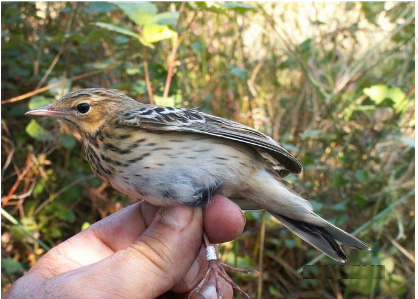
Foto 10. 21/09/2007. Nidificante local ou migrante?. Especie: Anthus trivialis .